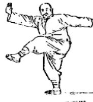
图 106 正面图