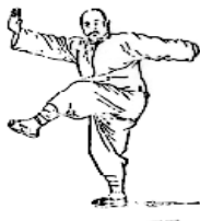
图 106 正面图