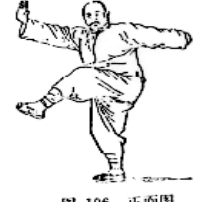
图 106 正面图