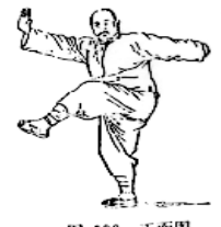
图 106 正面图