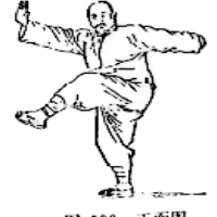
图 106 正面图